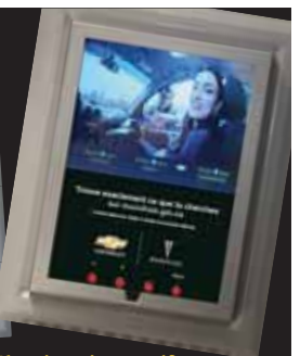
Classique interactif Avril 2007