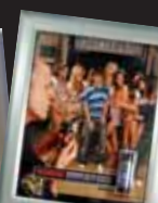
Classique moulé Juin 2006