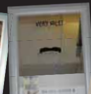
Classique miroir Mars 2007