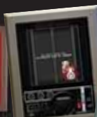
Panneau jeu video Mai 2006