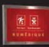
Panneau numérique Avril 2006